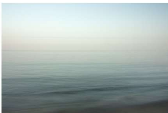
Fotografia, stampa inkjet su carta Hahnemühle Fine Art Baryta 325 g/m 2 , montata su alluminio