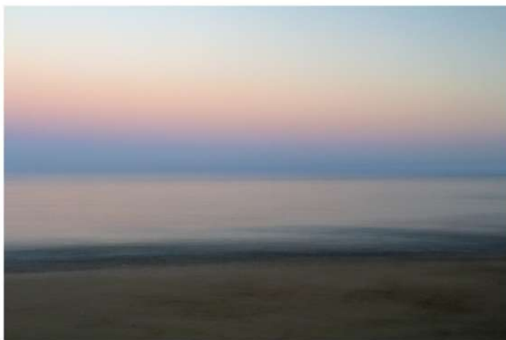
Fotografia, stampa inkjet su carta Hahnemühle Fine Art Baryta 325 g/m2, montata su alluminio