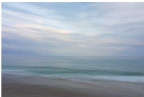
Fotografia, stampa inkjet su carta Hahnemühle Fine Art Baryta 325 g/m 2 , montata su alluminio