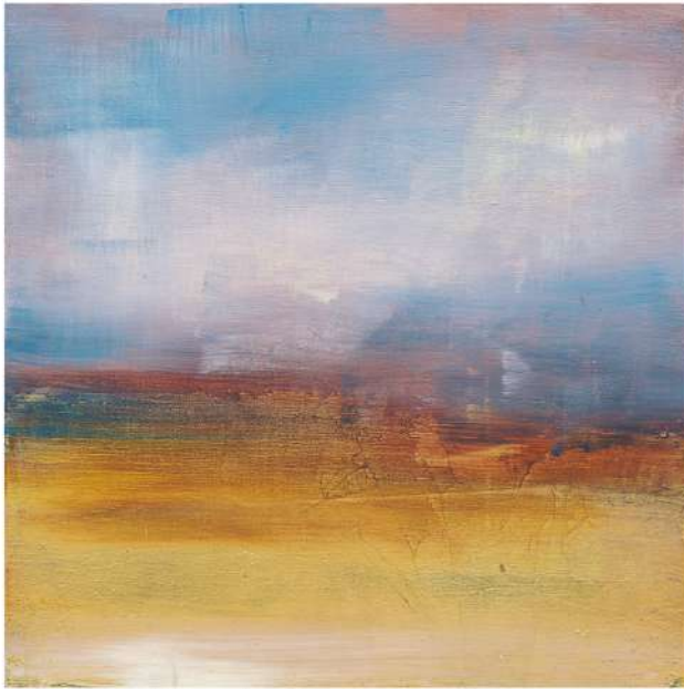
Olio e foglia d'oro su legno