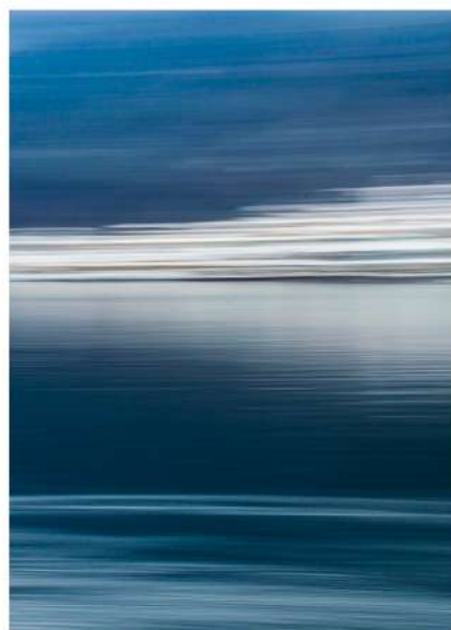
Intentional Camera Movement Photography