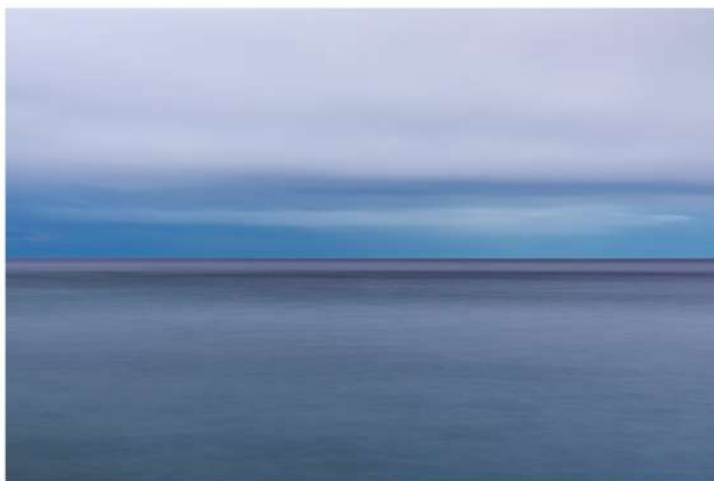
Fotografia, stampa inkjet su carta Hahnemühle Fine Art Baryta 325 g/m2, montata su alluminio