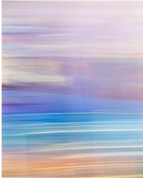
Intentional Camera Movement