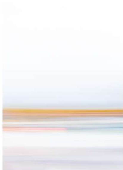
Intentional Camera Movement Photography