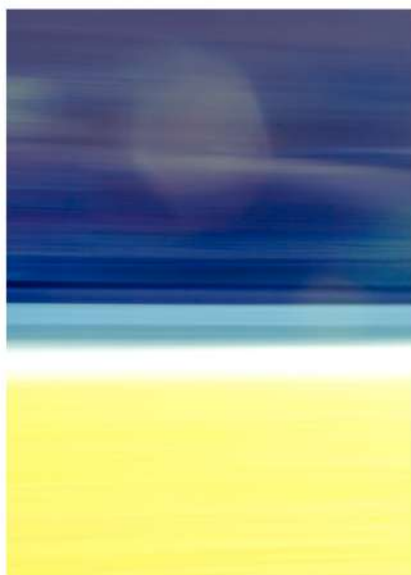
Intentional Camera Movement Photography