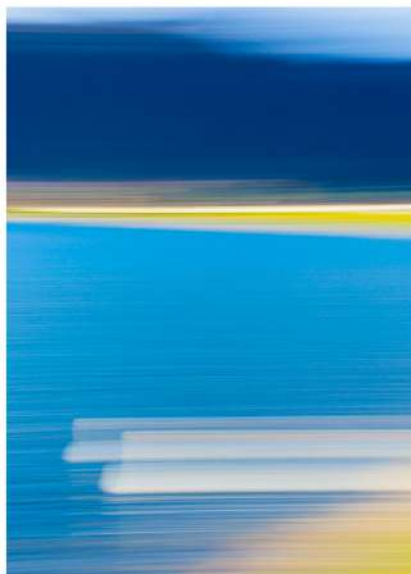
Intentional Camera Movement Photography