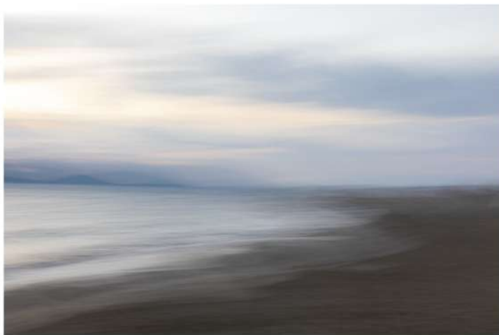
Fotografia, stampa inkjet su carta Hahnemühle Fine Art Baryta 325 g/m2, montata su alluminio